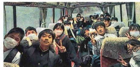
バスの中も大切な思い出

には、旅行後に詠んだ短歌の一部を紹介します。旅行中の出来事が目に浮かびます。 福岡市での班別研修や街頭インタビュー。大刀洗平和記念館での平和学習。熊本市では水前寺公園や熊本城を見学して、歴史を知り、地震後の復興の様子を見ることができました。その の後、阿蘇の雄大な自然に触れ、最終日はお待ちかねのグリーンランドを存分に楽しみました。引率の先生方、ありがとうございます、保護者の皆さん、早朝からの弁当の準備や送迎、お疲れ様でした。