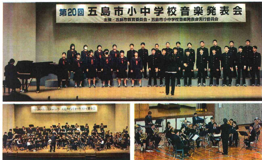
第20回 五島市小中学校音楽発表会

◆音を楽しんだ2学期◆ 【上写真】11月10日(金)小中学校音楽発表会が文化会館で開催され、3年生が素晴らしい合唱を披露しました。 【右写真】10月13日(金)東京からシエナウインドオーケストラを招いて本校体育館で演奏会を開催。本物の音に触れる機会になりました。 【左写真】10月22日(日)には五島ウインドオーケストラ演奏会が開催され、本校吹奏楽部も出演し、東京藝術大学や市内の吹奏楽部の皆さんと一緒に演奏しました。 ◆12月26日(火)吹奏楽部の代表4名が、諫早市で開催される県アンサンブルコンテストに挑戦します。